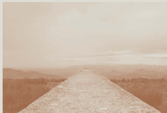
Photographies David Duchon-Doris Né en 1984; vit à Bayonne.

Installation pluri- disciplinaire : volume en bois, gravure sur bois brûlé et dispositif numérique Mickael Vivier Né en 1983; vit à Bayonne.